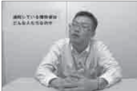
ソーシャルワーカーのインタビュー映像

ソーシャルワーカー：ソーシャルワーカーの役割／ソーシャルワーカーへのアクセス／地域の支援者とソーシャルワーカーの関わり方／通院している陽性者はどんな人たちなのか／陽性者の方からいつどんなニーズが発生するのか／地域の支援者へのアドバイス