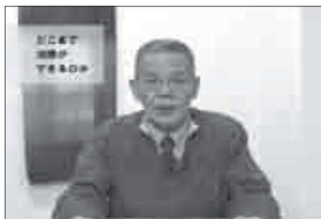
医師のインタビュー映像

きるのか／治療と生活／社会生活と仕事について／病気のイメージ／周囲（職場等）の陽性者への対応／様々な相談窓口や企業へ向けて